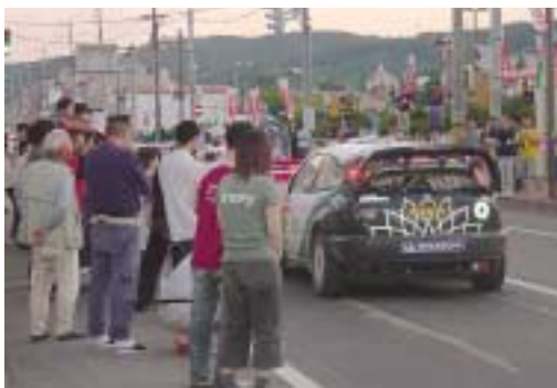
走行する車に多くの観客が応援

十勝管内陸別町・足寄町・新得町・幕別町・帯広市において九月三日から五日にかけて、WR（世界ラリー選手権）ラリー・ジャパンが日本で初めて開催された。期間中の十勝管内にお