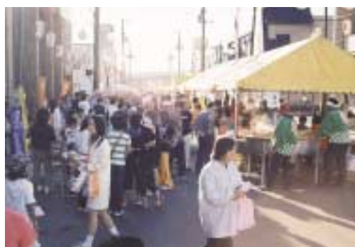
会場は多くの人で賑わった

恵まれ、弟子屈町の摩周メロンや厚岸町の海産物等を販売し、子ども達は思い思いに工夫を凝らし来場者に声をかけ「店員さん」になりきっていた。