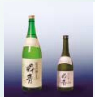
販売価格 720ml 1,575円 1.8ℓ 2,500円