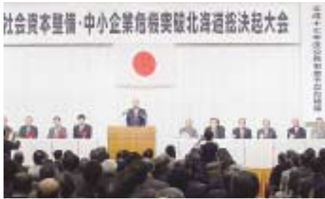
主催者を代表して挨拶する高向道商連会頭