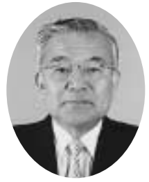
豊富町商工会会長