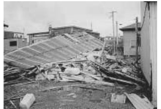
小平町 全壊した作業所

道商工連では、被災事業所に「台風十八号災害に係る商工貯蓄共済融資の特別措置等」を適用するなど、災害復興支援のための各種制度の紹介や支援等を積極的に実施しています。