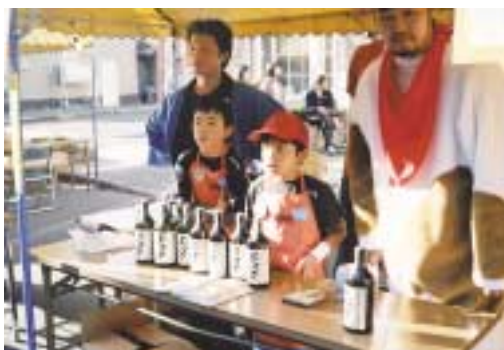
真剣に販売を行う子ども達と青年部員

釧路商工青連（曾我部元親会長）は、九月十一日・十二日の両日、白糠町の南通り商店街を会場に開催されたイベント、カミングパラダイスにおいて「ちびっこ商店」を出店した。 この「ちびっこ商店」は子ども達のおもしろ体験学習をテーマに、釧路管内各町村の特産品を地元の小学生に、「店員さん