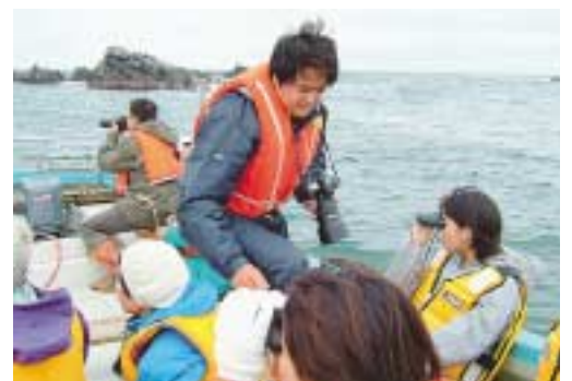
ゼニガタアザラシの調査

名が参加し、参加者はツアー客という立場ではなく、補助調査員という資格で参加した。ツアー内容は、帯広畜産大学ゼニガタアザラシ研究会の調査助手として、双眼鏡等で岩場のアザラシの個体数をカウント、