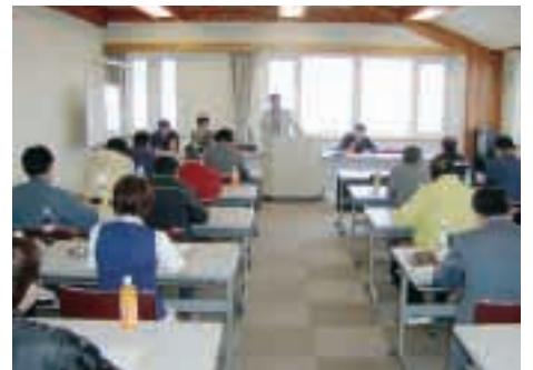
はまなか祝賀企画設立に向けての事業者説明会

浜中町では、年間約三十組が結婚式を挙げているが、このうち三、四組しか町内の文化センターを利用しておらず、人的負担や金銭的負担などの問題から、結婚祝賀会の多くは釧路市などで開かれている。近年の飲食、娯楽などの消費購買の町外流出とともに、地域経済低迷の