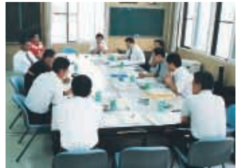
ワーキンググループによる検討作業

そこで町では、平成十八年度の着工が予定されている中心市街地を通る都市計画街路「大野